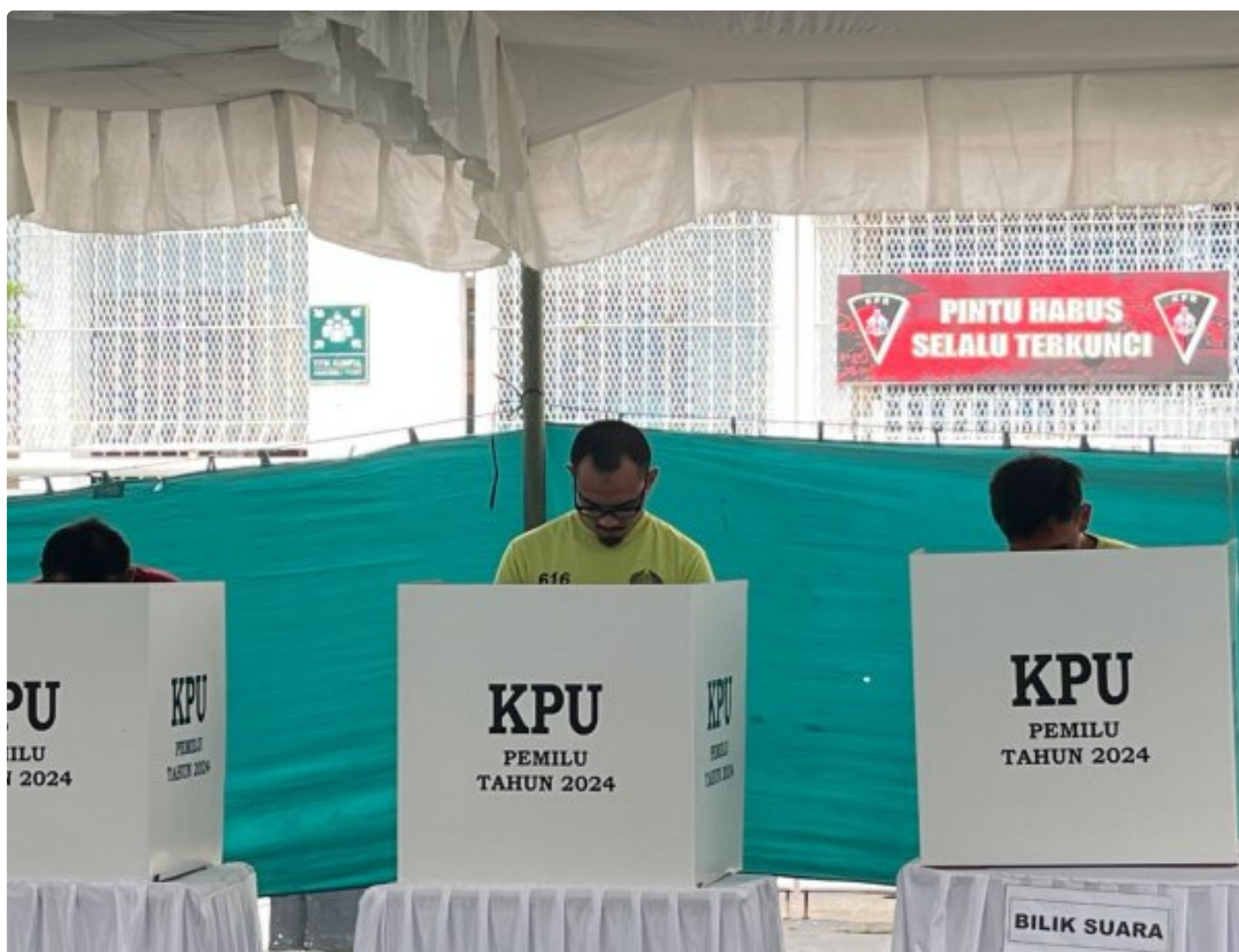
Pemilu di Rutan Surakarta

Intip Serunya Pilpres Di Rutan Surakarta, Paslon Nomor 2 Menang Telak